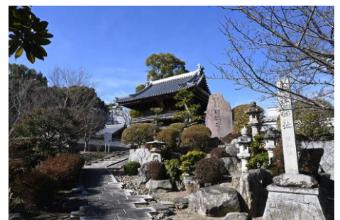
安祥城本丸跡の大乗寺

安祥城脇に遺構を残す「筒井」は「七つ井」のひとつです。人質交換の折、岡崎に帰る竹千代（家康）が立ち寄り、井戸水を気に入って竹筒に入れて持ち帰ったためその名がついたという説があります。