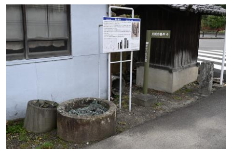
七井のひとつ、筒井