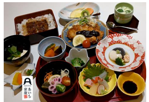
天下とりに勝つ御膳 名代の鰻重で心も体も鰻のぼり。

献立表も験を担いだ「当て字」を使う和食ならではの趣向で、健康で長命で、天下を勝ち取った家康にあやかり、食した人の運気が鰻のぼりになる御膳となっております。